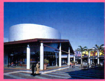
沖縄アウトレット モールあしびなー 豊かな自然と歴史、そして文化に彩られたこのリゾート空間にふさわしく、モダンな街並みに好感度の世界的ブランドアイテムが驚きの価格で溢れています。