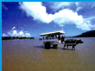
水牛車(竹富島) 島の集落をのんびりゆっくり巡る水牛車は、竹富島観光の名物。ガイドさんの名調子に耳を傾けながら、昔ながらの風情を残す町並みを味わってください。