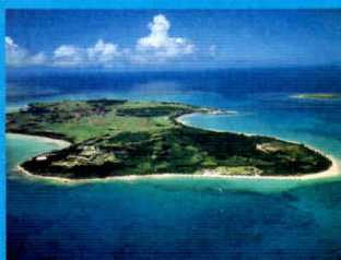
ピーナサイラ(西表島) 珍しい生き物も数多く息する大自然の宝庫。他では味わえない体験をこの島で味わってください。

美しい海と珊瑚礁に囲まれた八重山諸島の中心「石垣島」。 マングローブをはじめ、豊かな自然が生い茂った自然の宝庫「西表島」。 やさしく流れる時間の中で素朴な風景に心打たれる「小浜島」。 八重山諸島でしか味わえない、溢れる自然を大満喫!!