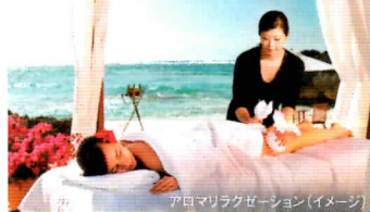
7日マリタラセッション(イメージ)