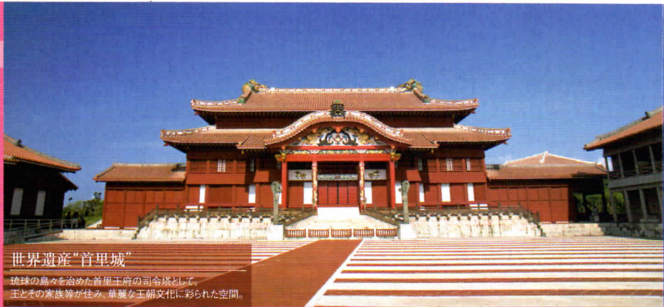
世界遺産「首里城」 琉球の島々を治めた首里王府の司倉塔として、 王とその家族等が住み、華麗な王朝文化に彩られた空間。

2013年10月15日～2014年4月5日まで エンジョイ美ら海号運行! 当パンフレットにてご予約の場合、おひとり様 ¥1,500 で乗車OK! 美ら海水族館とコラボした可愛いラッピングバスで、人気の観光施設を 楽々観光♪ 詳しくはP.11をご覧ください。