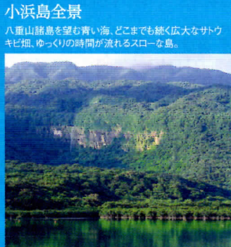
小浜島全景 八重山諸島を望む青い海。どこまでも続く広大なサトウキビ畑、ゆっくりの時間が流れるスローな島。